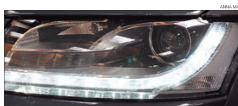
►► Faro de unos de los últimos modelos de Audi.

►► Algunas marcas, generalmente de gama alta (Audi, Volkswagen, General Motors y Volvo) ya incorporan de fábrica las luces de conducción diurna (LCD). Se trata de lámparas de bajo consumo y se conectan cuando arranca el coche. Cuando entre en vigor la directiva de la UE, en febrero del 2011, todos los vehículos deberán salir así de fábrica.