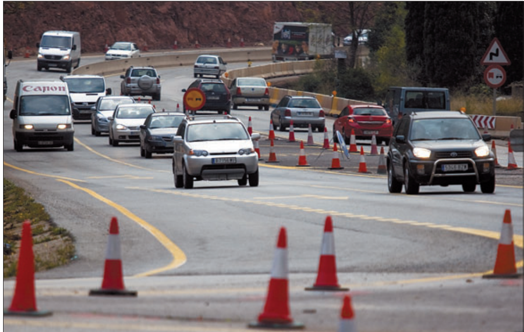
Varios coches circulan por la C-17 de día y con las luces encendidas, a la altura de Tagamanent (Vallès Oriental), el viernes.

Solo es sancionable la actitud contraria. No poner la luces de noche o en condiciones de baja luminosidad –como lluvia, niebla y nieve– y durante el crepúsculo y el amanecer. La DGT también deberá reflexionar sobre si hay que eliminar los carteles que a la salida de los túneles recuerdan al conductor con un interrogante y el dibujo de un faro que ya puede desconectar las luces.